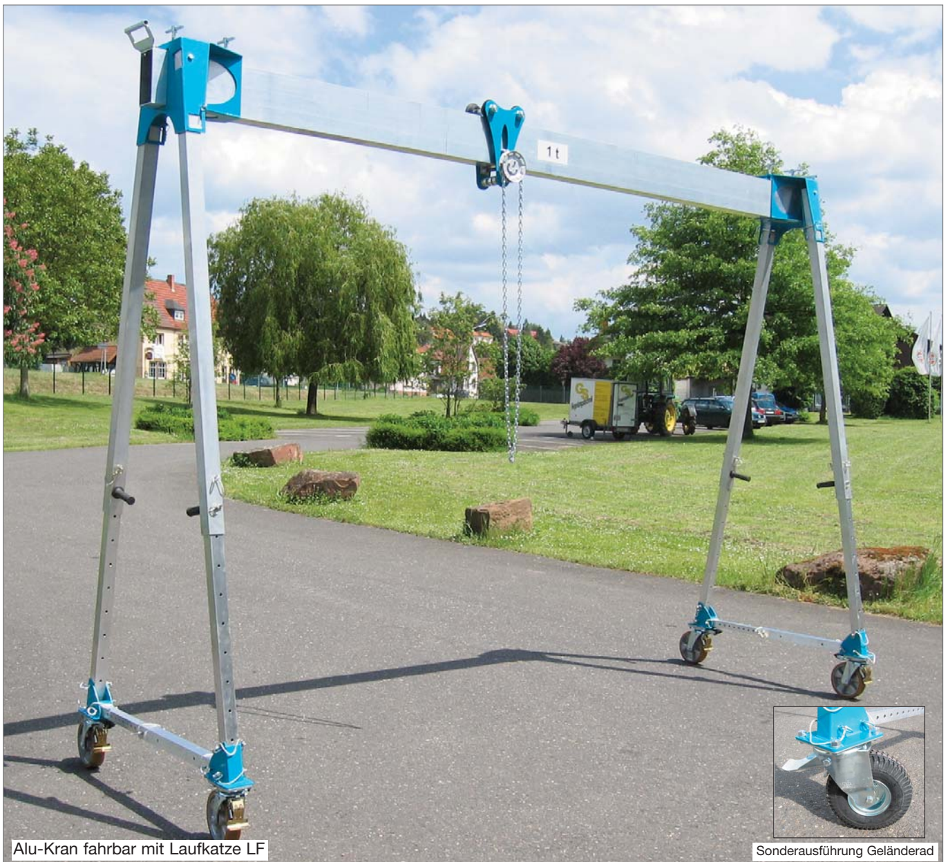
Alu-Kran fahrbar mit Laufkatze LF