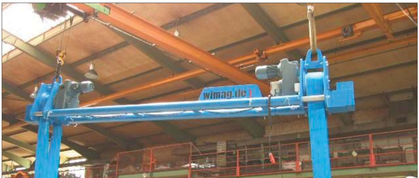
WG 7,5 - capacité de charge 7.500 kg