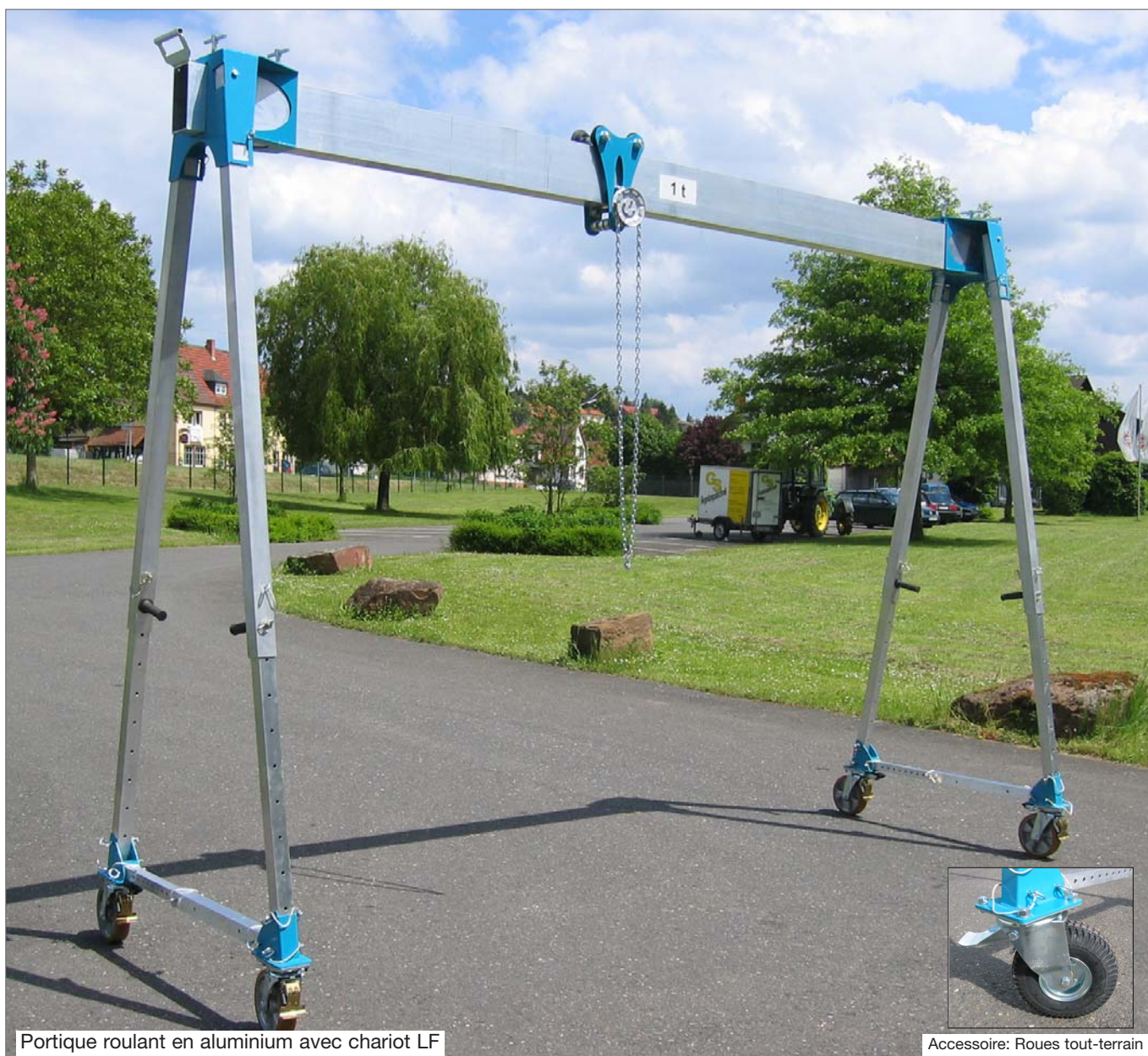
Portique roulant en aluminium avec chariot LF