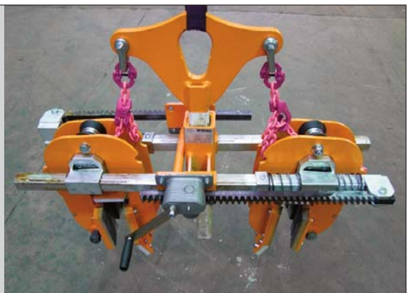
Rohrgreifer RG 3,5 mit gleichzeitiger, stufenloser Einstellung auf die Nennweite über Zahnstangenwinde