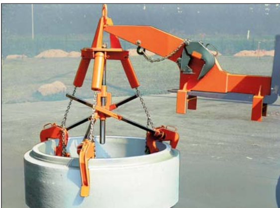
RGA-300 mit Kragarm KA-300 für den automatischen Staplertransport